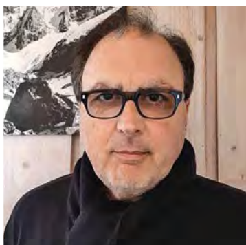
Hommage à D. Baschieri, extraits de son livre « Le regard de l'ange », The Book éditions